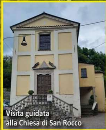
Visita guidata alla Chiesa di San Rocco